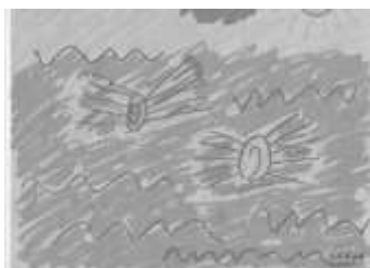
Takto si představují léto a konec prázdnin klienti chráněného bydlení Mravenec.

Dnešní stránku věnujeme konci léta a začátku školního roku jak je vidíme.